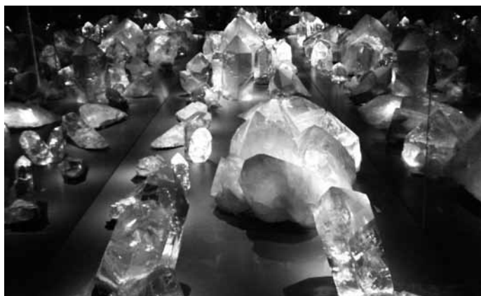
Der Schatz vom Planggenstock.

Das Mineral kommt in der Erdkruste häufig vor und wird seit der Eisenzeit um 1400 vor Christus für die Gewinnung von Eisen verwendet. Auch seit dieser Zeit fertigten Höhlenmaler ihre Kunstwerke mit Farbe aus diesem Gestein. Die rote Farbe des Hämatits entsteht durch die Modifikation des Eisen(III)oxids (Fe 2 O 3 ). Reiner Hämatit ist blauschwarz glänzend, deshalb hat er auch den Namen Eisenglanz. Die rote Farbe