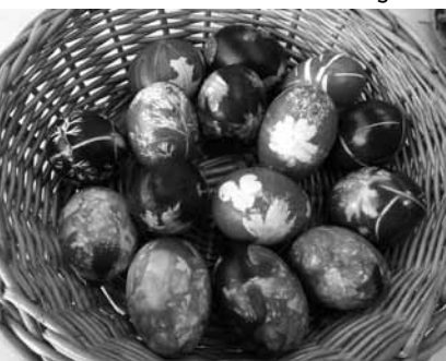
Zum Eierfärben eignen sich verschiedene Naturmaterialien.

Wer schon einmal Randen geschnitten hat, weiss es: Randen haben eine extrem intensive Farbe und färben stark ab. Wieso das Gemüse also nicht zum Färben verwenden? Es eignet sich sowohl der Kochsud als auch der Saft der Randen. In diesen Randensaft kann man beispielsweise ein saugkräftiges Papier stellen, das die Farbe wie ein Docht aufnimmt und übers ganze Papier verteilt. Randen eignen sich aber auch sehr gut zum Drucken. Dafür arbeitet man am besten mit einer rohen Rande und schnitzt ein Symbol oder Muster in das Gemüse. Anschliessend kann die Vorlage für mehrere Druckvorgänge verwendet werden. Rote Rüebli eignen sich zum Drucken übrigens auch hervorragend.