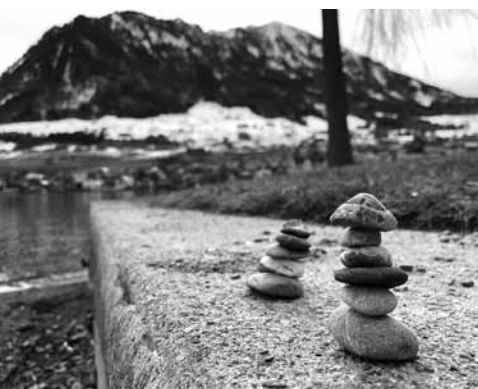
Steine am Vierwaldstättersee.

Bergkristalle haben eine fast mythische Ausstrahlung. Entstanden sind sie mit der Faltung der Alpen von rund 18 Millionen Jahren. Damit ein Kristall entstehen kann, müssen Temperatur, Druck und chemische Zusammensetzung über die Zeit der Auskristallisierung stimmen. Ein Bergkristall besteht aus reinem Siliziumdioxid (SiO 2 ) und ist farblos. Enthält der Kristall Flüssigkeiten, wird er zu einem Milchquarz. Der wohl bedeutendste Bergkristall ist der Schatz vom Planggenstock. Diese 300 kg schwere Kristallgruppe wurde im Jahr 2005 von zwei Strahlern auf der Göschenalp entdeckt und ist heute im Naturhistorischen Museum Bern zu bestaunen. Quarz kann auch künstlich hergestellt werden und wird heute zum Bei-