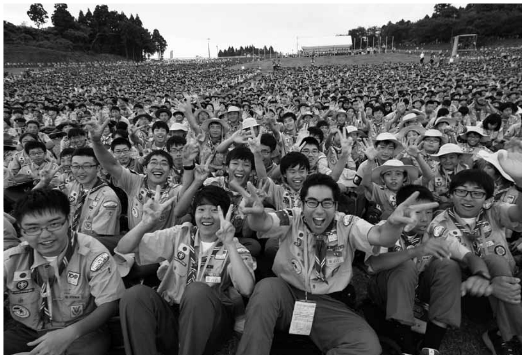
Japanische Pfadis am Jamboree in Japan 2015.

«Unsere Schweiz» würde ich dem Schweizer, der Schweizerin, den Schweizern entgegenhalten und sagen, eigentlich bedeute es das gleiche, nur noch viel mehr. Es ist eine Einladung. Eine Einladung unsere Schweiz zu genießen, einen Teil zu unser allen Leben beizutragen. Eine Einladung schliesst übrigens das Ausschliessen von Nichtgewollten nicht aus. Man kann Einladungen widerrufen, jemanden ausladen. Aber mit einer Einladung lässt sich die Schweiz genauso gestalten.