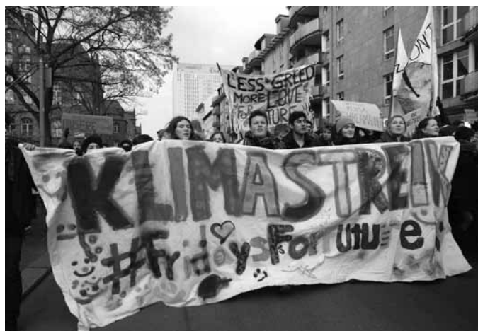
Klimastreik im Januar dieses Jahres in Berlin. Schülerinnen und Schüler stehen friedlich für ihre Zukunft ein.

sähe auch attraktiv aus, aber ein Leben ausschliesslich ohne Farben, das wollen dann wohl nur die wenigsten. In Schwarz / Weiss zu denken hingegen, ist nicht nur ein Verlust an Kreativität. Es ist auch, der Leser, die Leserin entschuldige das Wort, einfältig. Es sind einfache Schlagworte, die so geprägt sind, dass sie ein scheinbar eindeutiges Bild generieren. «Die Schweiz den Schweizern!» ist für mich so ein Beispiel. Wenn ich diesen Satz höre, dann lässt er für mich nur eine Interpretation zu: Es gibt Schweizer und andere und diese Anderen sind nicht willkommen. Es schliesst alle aus, nicht nur die geflüchteten Menschen. Auch die Touristen und guten Steuerzahler, welche solche Kampagnen unwissentlich manchmal mitfinanzieren.